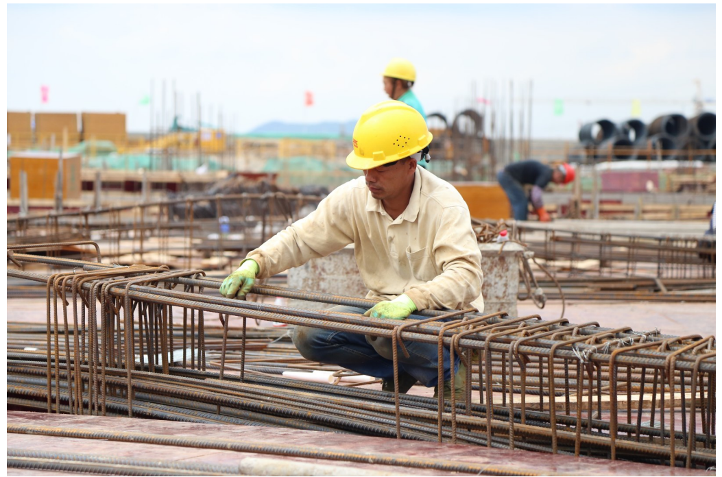
物流新城的一线工人