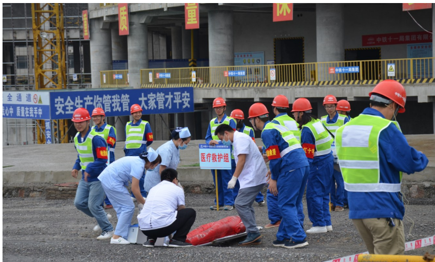
演练中,医务人员现场救治伤员

可操作性,以确保发生安全事故时救援工作及时、有效,把事故造成的损失降到最低,以提高所有工作