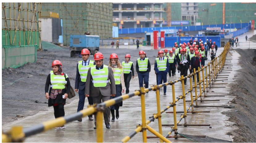
考察团参观高铁新城