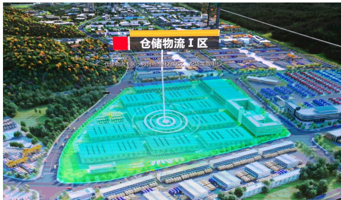
仓储物流I区效果图