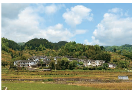
美丽乡村