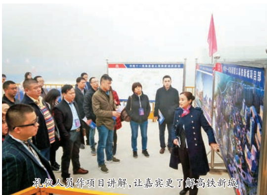
礼仪人员作项目讲解,让嘉宾更了解高铁新城