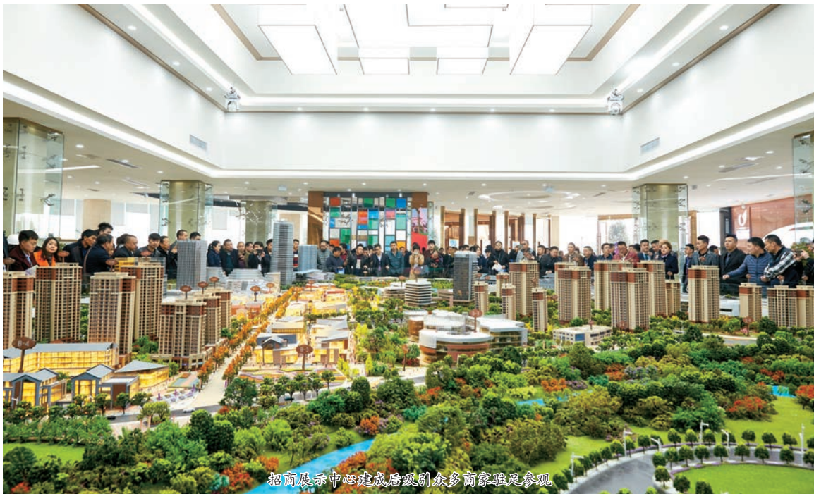
招商展示中心建成后吸引众多商家驻足参观

项目、全市转型升级项目,我们将严格按照‘新枢纽、新地标、新业态、新商圈’这一要求,将高铁新城打造成遵义城市新名片。在2017年底向全市人民交上一份满意的答卷。” (潘黎娜)