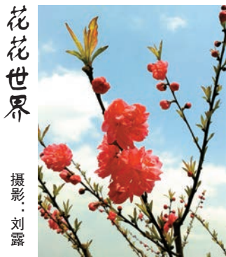
花花世界