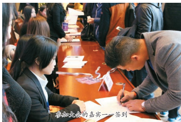
参加大会的嘉宾一一签到