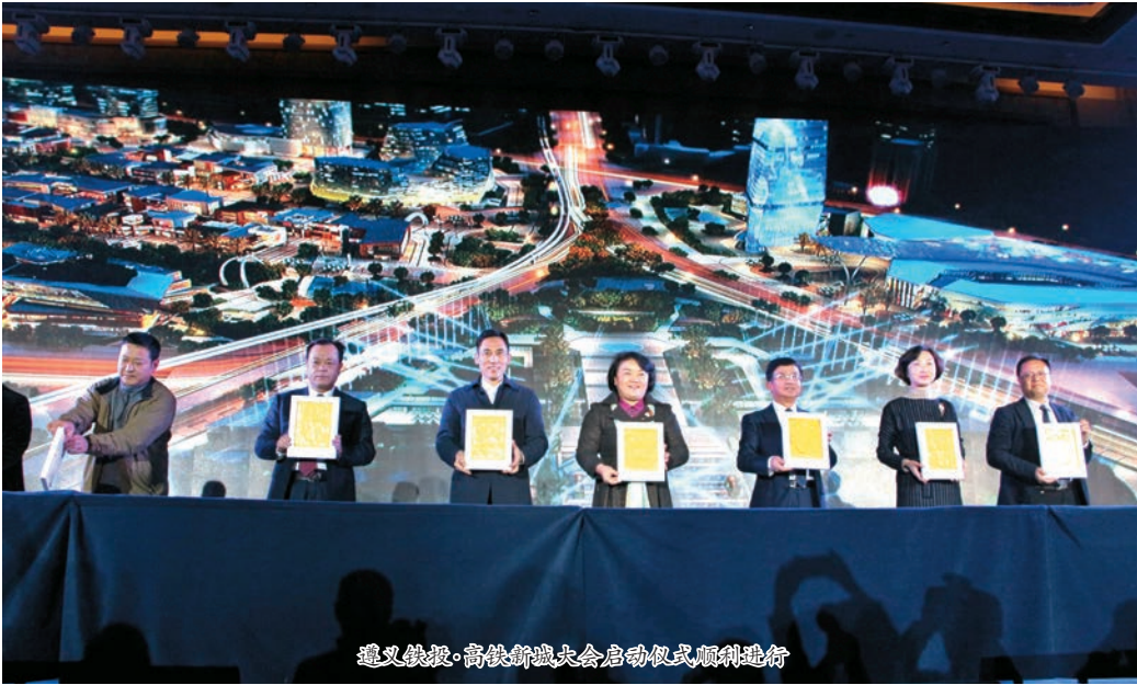
遵义铁投·高铁新城大会启动仪式顺利进行

本报讯 2016年12月8日,由遵义市人民政府主办,遵义市新蒲新区管理委员会、遵义市投资促进局协办,遵义市铁路建设投资(集团)股份有限公司承办的“遵义铁投·高铁新城创投招商大会”在遵义圆满召开。相关政府领导、省内外知名商家代表、意向投资者及主流媒体约700人参加了本次大会,共同见证这场盛大的商业盛宴。