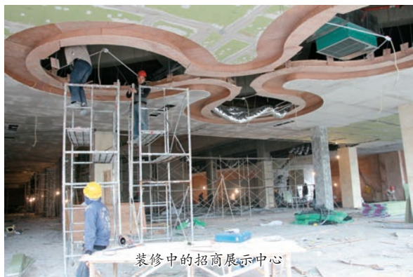
装修中的招商展示中心